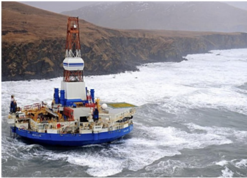
Shells Bohrplattform „Kulluk“ lief am 1. Januar 2013 während eines schweren Sturms in der Nähe von Kodiak Island, Alaska, auf Grund.

Die meisten Bohrunfälle, inklusive der gefürchteten Blow-Outs, passieren in flachen Gewässern unter 150 Meter Wassertiefe. 4